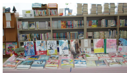
*大社中学校学校図書館の様子* (一例)

ブックトークとは、 どのように紹介するかということより、ど んな本を紹介するかが大切。 “ぜひこの本を子どもたちに手渡したい” と思う本をふやしていくこと 「宇田講師より」