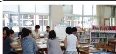
西野小学校での様子

何回か傷んだ本の修理やブックコートかけの講習を受けるうち、本の修理だけでなくもっと自分にできそうな活動へと話が広がる学校もありました。頼もしい限りです。