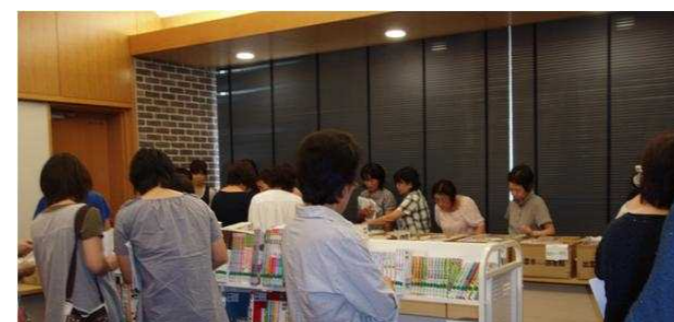
*「学校図書館活用教育図書」にはどんな本があるの?

ブックトークとは、 どのように紹介するかということより、ど んな本を紹介するかが大切。 “ぜひこの本を子どもたちに手渡したい” と思う本をふやしていくこと 「宇田講師より」