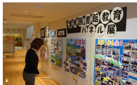
学校図書館教育パネル展開催中!!